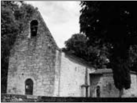
Église de Sagelat (Dordogne)