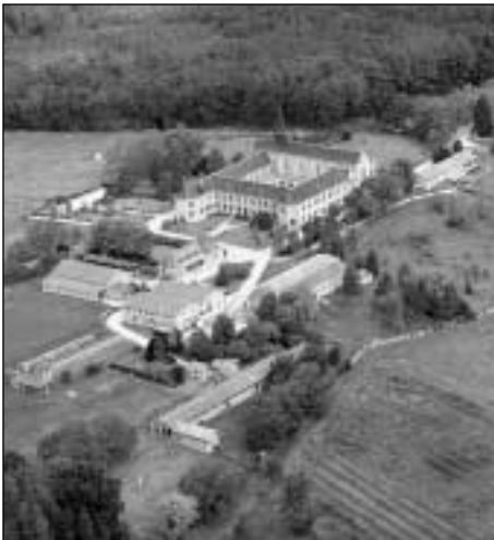
Abbaye Notre-Dame de Bonne Espérance Vue aérienne

Sertie dans une vaste clairière de prés à pâture et bordée d'une chaîne d'étangs, qui lui font un cadre à la fois austère et pacifiant, elle est accueillante pour l'arrivant qui la découvre à l'embranchement de la D 38 et agréable pour qui y séjourne