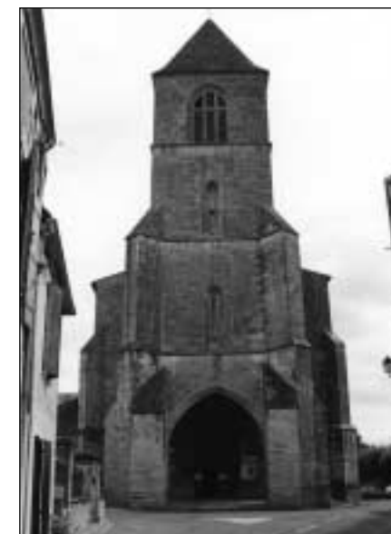
Église de Belvès (Dordogne)