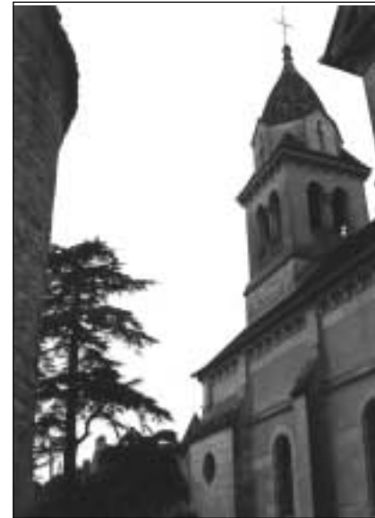
Église de Paleyrac (Dordogne)