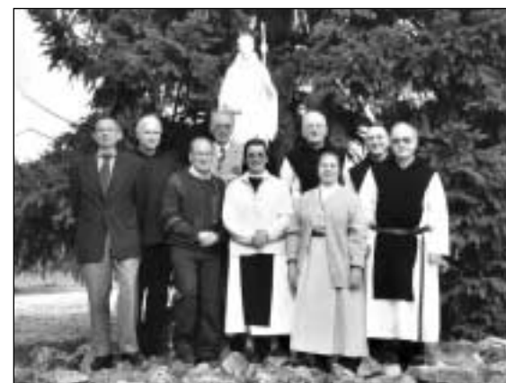
Le conseil d'administration

Ce Conseil a permis aux administrateurs d'avoir une réflexion approfondie sur des sujets importants comme la communication de la Fondation vis à vis des communautés monastiques mais aussi des donateurs, la politique de secours et les finances. En voici les principales résolutions.