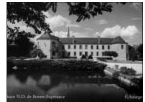
Échourgnac L'abbaye vue du sud

7 Donne verre à vitraux à monastère, spécialement du rouge et du bleu. S'adresser au 01 60 68 57 28.