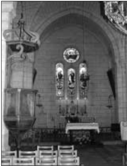
Chœur de l'église de Paleyrac où est inhumé M r Gouzot (à gauche de l'autel).