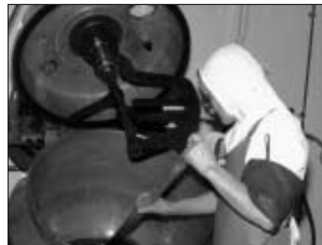
Abbaye Notre-Dame de Bonne Espérance Confection des confitures

En 1982 et en 1987, l'hôtellerie fut agrandie, en prenant sur l'aile du dortoir de la communauté, jusqu'à atteindre une capacité de vingt-cinq chambres. Mais la communauté ainsi resserrée se trouvait bien à l'étroit... En septembre 2001, un nouveau