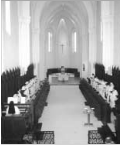
Abbaye Notre-Dame de Bonne Espérance Chœur