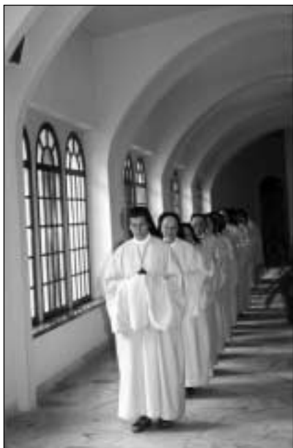
Abbaye Notre-Dame de Bonne Espérance Procession des sœurs dans le cloître

qui était grande. Développement au maximum de la formation initiale et continue, dans tous les domaines : spirituel, intellectuel, liturgique, technique ; adaptation et rénovation de la liturgie et accueil liturgique de nos hôtes, développement de relations de collaboration et d'amitié avec les organes de gouvernement et les autres communautés de l'ordre monastique, surtout les plus pauvres d'Afrique Noire et d'Amérique Latine, renforcement des liens cordiaux avec les prêtres et les communautés chrétiennes de notre diocèse et des diocèses voisins, mais aussi avec les autres Églises locales dans le monde et avec des communautés d'autres