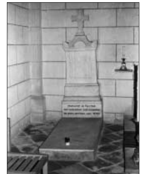
Tombe de M.gr Gouzot, archevêque d'Auch dans l'église de Paleyrac (24) après l'expulsion des Chartreux de Vauclaire

Le domaine de Véziac fut vendu et divisé. De la maison il ne reste que quelques murs en ruines soutenus par de beaux entourages de portes. Les cheminées et les boiseries ont été vendues. Dans la cour la margelle d'un puits est ornée d'un écusson daté de 1661. C'est le seul témoignage qui subsiste d'un passé qui ne manquait sans doute ni de beauté ni de grandeur.