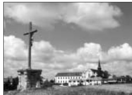
Abbaye Notre-Dame de Bonne Espérance