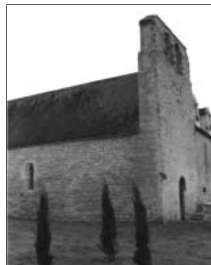
Église de Montplaisant (Dordogne)

Ayant quitté Aiguebelle Dom de Lestrangle se rendit au monastère de Lyon-Vaise peuplé par les moniales de la Riedera qui avaient occupé successivement Frenouville en 1816 et Lyon Croix-Rousse de 1817 à 1820. C'est là qu'il mourut le 16 juillet 1827.