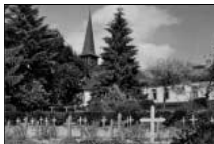
Échourgnac Le cimetière des moines (1868-1910) et des moniales (depuis 1923)

Le monastère d'Échourgnac put ainsi être réoccupé par la communauté d'Espira de l'Agly, au retour de son exil à Herrera, en 1922.