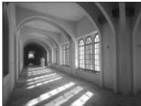
Abbaye Notre-Dame de Bonne Espérance Cloître

L'année suivante, en 1969, on put enfin s'occuper de la cuisine. La partie de la maison dans laquelle elle se trouvait étant