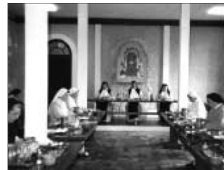
Abbaye Notre-Dame de Bonne Espérance Réfectoire

délabrée et dangereuse, on construisit d'abord, en prolongement de la quatrième aile, un bâtiment de 15 m de long qui abritera au rez-de-chaussée une vaste cuisine et ses dépendances et aux étages vestiaire, bureaux et salle de chant. En 1972, on put s'occuper de la partie de bâtiment où se trouvait l'ancienne cuisine. Les poutres maîtresses, gros fûts de chêne de 40 cm d'épaisseur sur 8 m de long étaient complètement vermoulues. Il fut donc décidé de tout démolir, de la cave au grenier: trou béant de 8 m de côté sur 13 m de hauteur. Le réfectoire, adjacent à l'ancienne cuisine, ne valait guère mieux et sombra lui aussi dans la démolition; mais les piliers du réfectoire soutenaient le 1er étage, qui dut être étayé depuis la cave jusqu'à ce que ces piliers soient rétablis: entreprise hardie, que les entrepreneurs réussirent sans troubler la vie de la communauté.