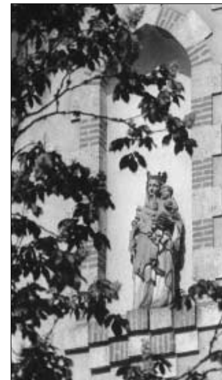
Abbaye Notre-Dame de Bonne Espérance Vierge de la façade