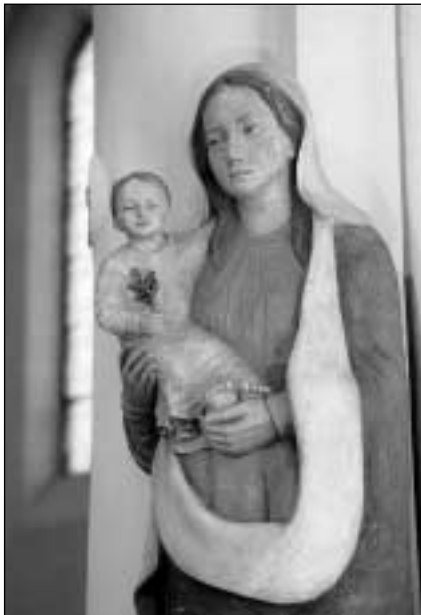
Échourgnac Vierge de l'église

Saint Antoine le Grand conseillait souvent à ses disciples de commencer chaque jour comme si l'on débutait dans l'ascèse, oubliant le chemin parcouru et se souvenant de la parole du prophète Élie : « Le Seigneur est vivant, devant qui je me tiens aujourd'hui ».