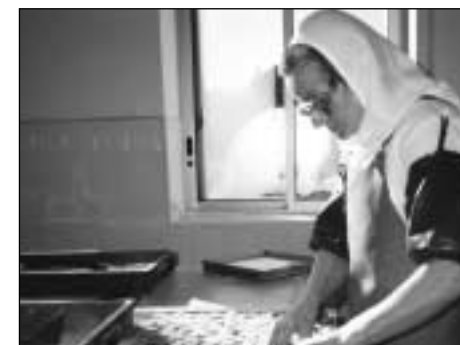
Abbaye Notre-Dame de Bonne Espérance Confection de pâtes de fruits