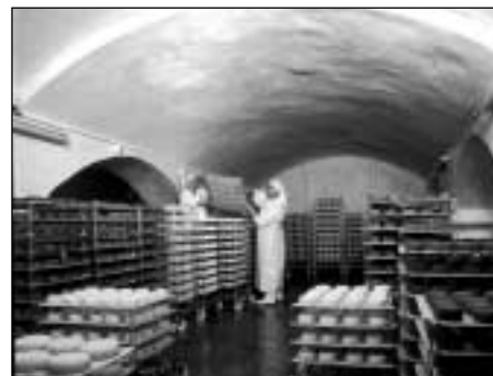
Abbaye Notre-Dame de Bonne Espérance Fromagerie

Le premier soin fut de reconstituer, en une dizaine d'années, un troupeau laitier de 40 têtes - sans argent, bien sûr - et de développer en même temps la porcherie, indispensable pour absorber les sous-produits de la fromagerie.