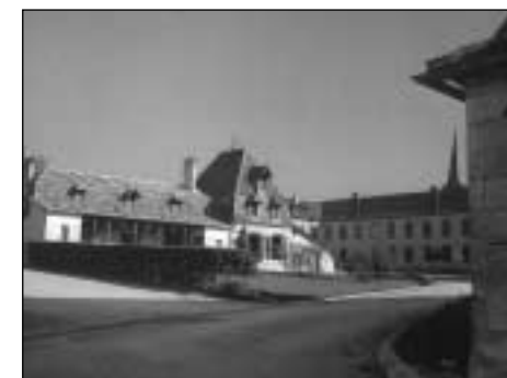
Abbaye Notre-Dame de Bonne Espérance Cour intérieure et chalet de Biscaye

celui-ci répondait à l'abbé de Port-du-Salut, Père immédiat des deux communautés. L'affaire était normalement du ressort du Chapitre Général, mais compte tenu des circonstances présentes, rendant incertaine la tenue d'un Chapitre, et de l'urgence de la situation, il nommait une commission restreinte d'abbés compétents pour étudier la question; le Définitoire (conseil restreint de l'Abbé Général), agissant au nom du Chapitre Général, se prononcerait au vu des conclusions de cette commission.