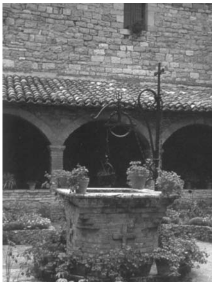
Puits Saint-Damien

C'est dans cet amour également que s'enracine l'affection, à la fois maternelle et exigeante, qu'elle voue à ses soeurs. Elle les a reçues comme un don de Dieu, en même temps que sa propre vocation. Claire n'avance jamais seule ; c'est avec ses soeurs