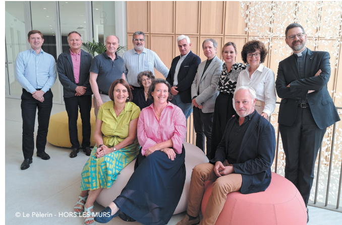
Le jury réuni le 13 juin dernier dans les locaux du Pèlerin 1.